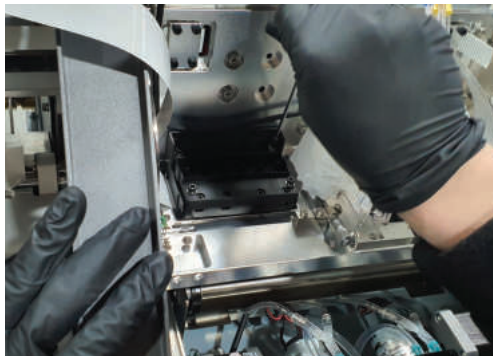
숙련된 엔지니어에 의한 국내 조립 및 엄격한 QC 프로세스